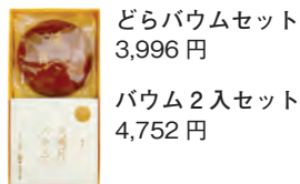
どらバウムセット 3,996円

2入り 1,080円 直径約11.5cm 1,620円 直径約13cm 2,160円 直径約15cm