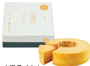
大満月バウム 2,160円 直径約14cm