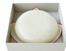
一升餅 3,240 円

富山県産新大正もち米を使ったお餅は、コシ・のび、なめらかさを兼ね備えたおいしさ極まるお餅です。杵つきでおあつらえいたします。