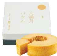
大満月baum 2,160 円 直径約 14cm